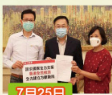
工聯會代表與中聯辦何靖副主任會面 再次請求國家支援本港建立方艙醫院及派出醫療隊支援全民檢測工作。