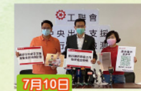
召開記者招待會 要求政府推行全民檢測。