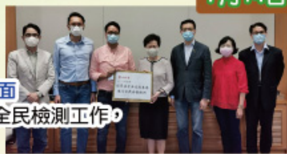
與林鄭月娥特首會面 要求政府盡快落實全民檢測工作，堵截隱形傳播鏈。