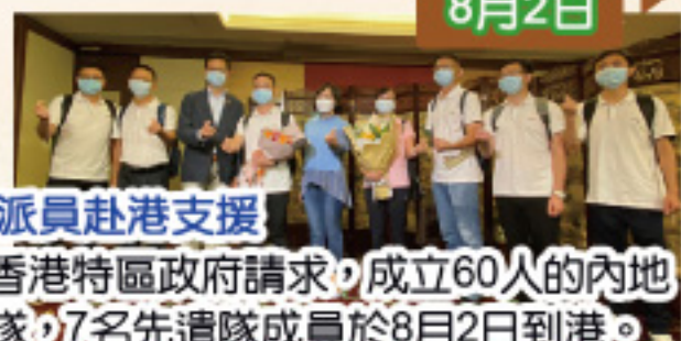
成功爭取中央派員赴港支援 國家衛健委應香港特區政府請求，成立60人的內地核酸檢測支援隊，7名先遣隊成員於8月2日到港。